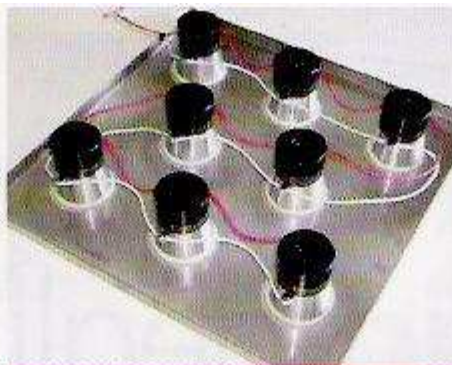
Trasduttore ad alta potenza in acciaio inox.

Il processo che propone Ultrasuoni Industrial Engineering copre integralmente tutte le esigenze di lavaggio e di protezione dello stampo, in modo da preservarlo da possibili ossidazioni sino al suo