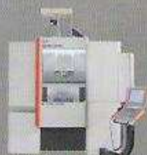
MIKRON HPM 800U