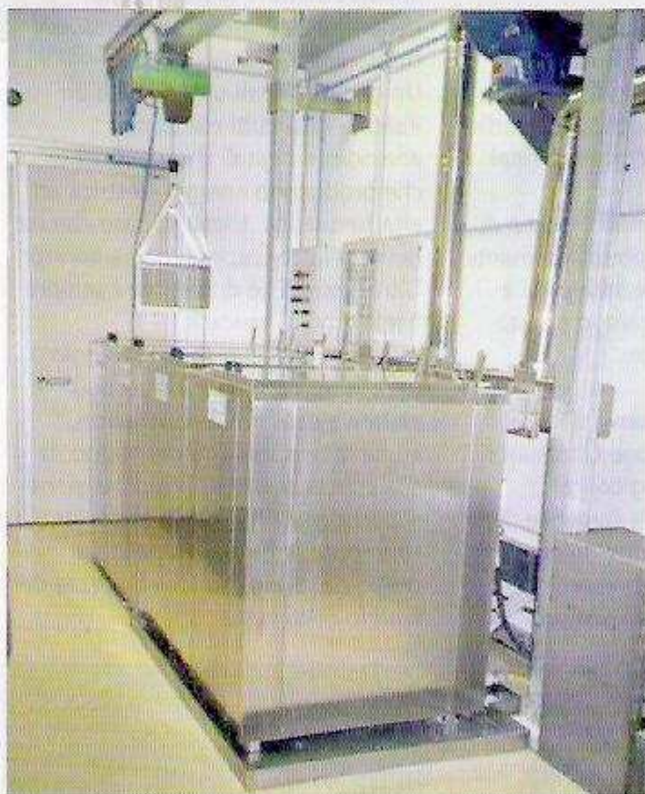
Impianto di lavaggio con detergente, risciacquo idrocinetico, protezione e asciugatura stampi.

Le macchine a ultrasuoni per il lavaggio stampi sostituiscono tutti gli impieghi con solventi o con prodotti chimici aggressivi, per questo sono altamente ecologiche e sicure".