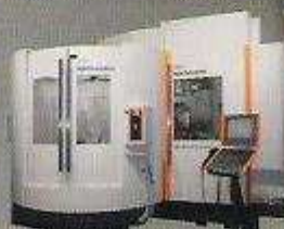
MIKRON HPM 1350U