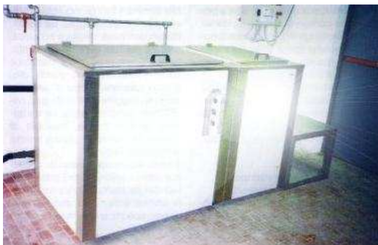
Nella foto: Impianto di lavaggio ad ultrasuoni, con sgrassatura, risciacquo e asciugatura con protezione finale.

Il totale rispetto dimensionale di pezzi e stampi, anche se pre-trattati con nichelature, cromatazioni e nitrurazioni ioniche, è elemento sostanziale di questo specifico sistema di pulitura elettronica con ultrasuoni di alta efficienza.